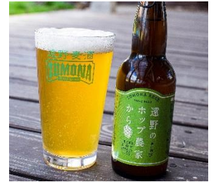
遠野麦酒 ZUMONA 遠野のホップ農家から

～IBUKI HOP SAISON～ 遠野産 IBUKI ホップ 100%！ IBUKI の穏やかな苦みと相まって春を感じさせる軽快な味わいです！ 数量限定：200杯/日