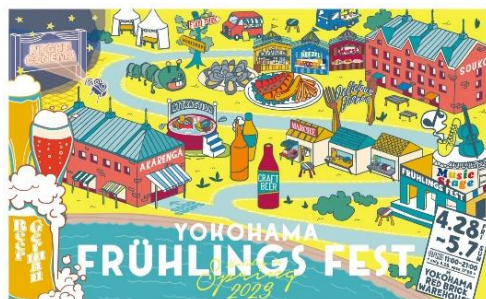
<イベントキービジュアル>

横浜赤レンガ倉庫では、4月28日(金)から5月7日(日)までの計10日間、イベント広場と赤レンガパークにてドイツの春祭りを横浜赤レンガ倉庫らしく再現した『Yokohama Frühlings Fest 2023』を開催します。『Frühlings Fest』とは、春の訪れをお祝いするドイツのお祭りで、家族や仲間と共にドイツビールやフード、ドイツ楽団の演奏等を楽しみながら春の一日を過ごす様子が風物詩となっています。9回目の開催となる今年は、クラフトビールの展開でより多彩なビールが楽しめるほか、地産地消やフードロス削減などをテーマにしたマルシェや、日にち限定の野外シアター「SEASIDE CINEMA 2023」など、一日中お楽しみいただけるコンテンツをご用意。環境に配慮したサステナブルな取り組みも推進していきます。