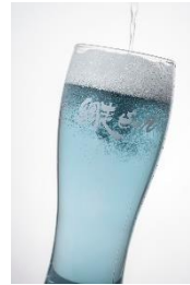
網走ビール 流氷ドラフト