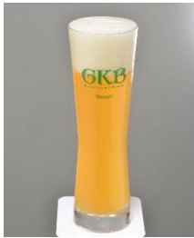
御殿場高原ビール ヴァイツェン

～IBUKI HOP SAISON～ 遠野産 IBUKI ホップ 100%！ IBUKI の穏やかな苦みと相まって春を感じさせる軽快な味わいです！ 数量限定：200杯/日