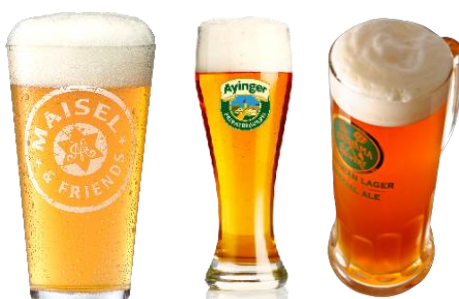
<ドイツビール・クラフトビールイメージ>