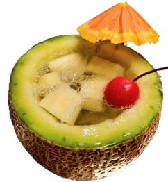
まるごとメロンカクテル

かぼすとはちみつを使用したフルーツエール。バランスのとれたスムーズで爽やかな甘みが喉の渇きを癒します。