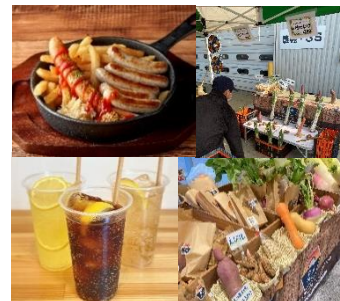
<その他販売メニューイメージ>