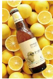
サントガーレン 湘南ゴールド

ホップ由来の柑橘を思わせる清々しい香り、しっかりとした苦味のバランスが絶妙。 数量限定：300杯/日