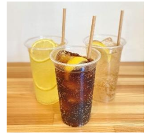
クラフトドリンク

日本一のメロン生産量を誇る茨城県銚田市のメロンをまるごと使用したオリジナルカクテル。 ※ノンアルコールでの提供も可