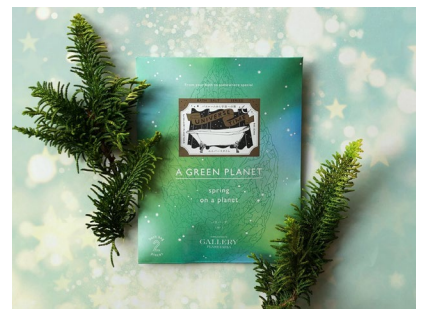
「ユニバースタイム (GREEN PLANET)」イメージ