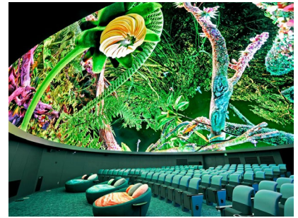
ドーム内 上映イメージ

当プランでは、横浜駅やみなとみらい線新高島駅から徒歩圏内の「プラネタリア YOKOHAMA」を始めとしたコニカミノルタプラネタリア全5館でご利用いただける全館共通鑑賞引換券を1泊1名様につき1枚お渡しいたします。