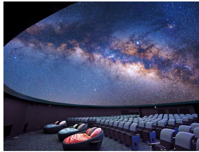
ドーム内 上映イメージ