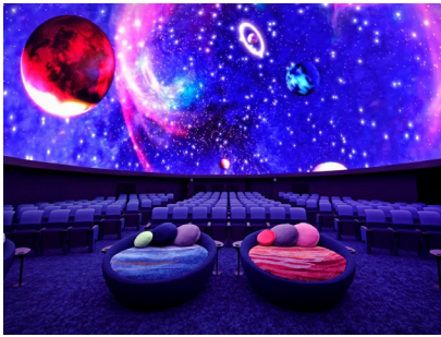
ドーム内 上映イメージ

「コニカミノルタプラネタリア YOKOHAMA」は2022年3月24日(木)にグランドオープンしたコニカミノルタプラネタリアの5つ目となる直営館。日本初のLEDドームシステム「DYNAVISION®-LED」による鮮やかで美しい映像をご覧いただけるだけでなく、併設するカフェやショップには星や宇宙をモチーフにしたアイテムを揃えた、総合的なエンタテインメント空間としてお楽しみいただけます。