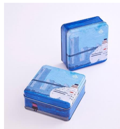
クッキー缶デザインイメージ

※写真はすべてイメージです。 ※料金はサービス料・税金を含みます。 ※内容は状況により変更する場合があります。