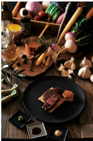
鉄板焼「よこはま」 5月・6月メニューイメージ