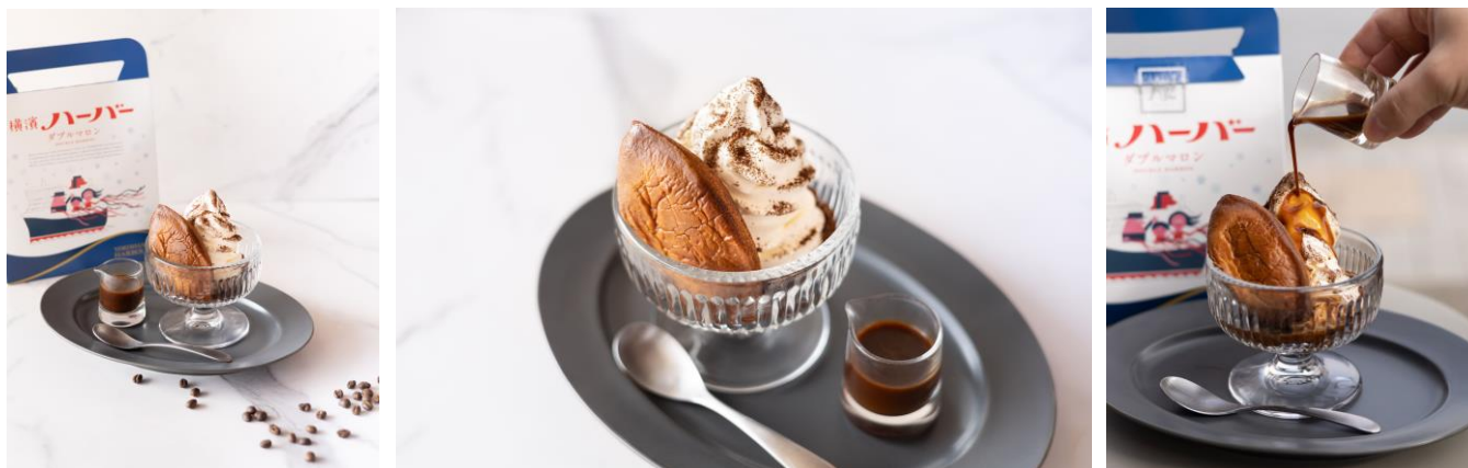
<コラボメニューイメージ>

このプロジェクトから「横浜赤レンガ倉庫」に店舗を構える、横浜の銘菓“ありあけハーバー”を販売する「ありあけ」と、株式会社GRACEが運営し、近年横浜エリアを中心に店舗展開している「UNI COFFEE ROASTERY」のコラボが実現し、横浜赤レンガ倉庫限定の特別メニュー『ハーバーアフォガート』を開発。この度、期間限定で販売することが決定しました。