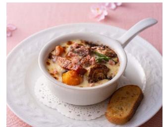
「チキンの赤ワイン煮 モッツアレラチーズ焼き 桜香るメルバトーストを添えて」

最善を尽くし取り組んでまいります。詳細はホテル公式ホームページをご覧ください。 https://ybht.co.jp