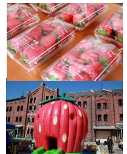
<コンテンツイメージ>