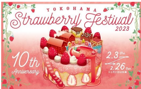
<イベントキービジュアル>

横浜赤レンガ倉庫では、2023年2月3日(金)から2月26日(日)までの合計23日間で、お子様から大人まで多くの人に愛されている“いちご”の新しい楽しみ方を伝えるイベント、『Yokohama Strawberry Festival 2023』を開催いたします。本イベントは、2013年に初開催し、今回で10周年を迎えます。これまでの10年間で来場者は延べ約160万人にのぼり、思う存分にいちごを楽しめるイベントとしてご好評をいただいております。