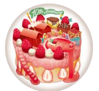
<オリジナル缶バッジイメージ>