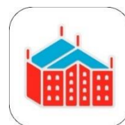
<横浜赤レンガ倉庫イベント公式アプリ>

「横浜赤レンガ倉庫イベント公式アプリ」のユーザー限定で、入場料が 200 円引きの 100 円となるお得な特典をご用意！さらに同アプリ内のスタンプラリーでは、会場及び館内のチェックポイントでスタンプを集めることで、イベント限定のオリジナル缶バッジをプレゼント！ぜひアプリを利用して、メモリアルな“いちごの祭典”を楽しみ尽くしてください。