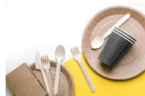
<脱プラスチックイメージ>

横浜みなとみらい 21 地区の「脱炭素先行地域」の取り組みに参画する施設として、「GTL 燃料」での発電によるイベントでの CO2 排出対策のほか、「容器・カトラリー類の非プラスチック製品化」による脱プラスチックの取り組みなど、「笑う、サステナブル」をコンセプトに、横浜赤レンガ倉庫らしいサステナビリティ活動を推進します。