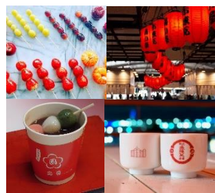
<その他会場コンテンツイメージ>