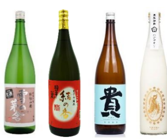
<日本酒・お酒 販売メニューイメージ>