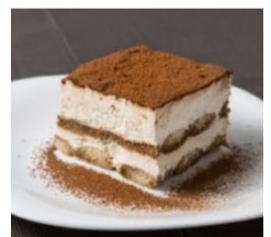
<ほうじ茶のティラミス>