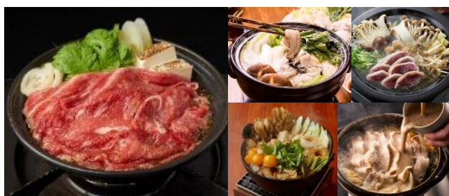
<ご当地鍋 販売メニューイメージ>

横浜赤レンガ倉庫では、2023年1月13日(金)から1月29日(日)までの計17日間、日本各地のご当地鍋や地酒などが堪能できる冬の恒例イベント『酒処 鍋小屋 2023』を開催します。(今回で7回目の開催)『鍋小屋』は、寒さが厳しい季節に、横浜赤レンガ倉庫と海が見える開放的な空間で熱々の鍋を囲み、お客様同士の交友を深めていただきたいという想いから生まれた冬のフードフェスティバルです。例年20万人以上の方に来場いただき、鍋と酒にとどまらない多彩なコンテンツを、老若男女あらゆる世代・それぞれのスタイルでお楽しみいただけます。