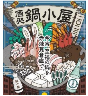
<イベントキービジュアル>

※お客様に安心してイベントをお楽しみいただけるよう、新型コロナウイルス感染症予防と感染拡大防止のための取り組みを実施しています。