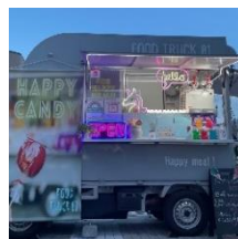
<りんご飴のキッチンカー>