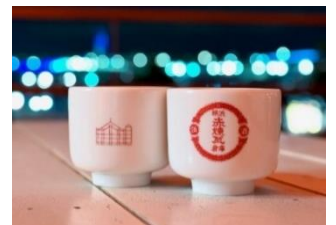
<オリジナルお猪口>