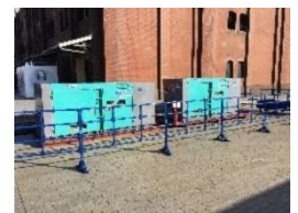
<GTL 燃料発電機イメージ>