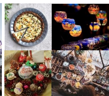
<販売グッズイメージ>

横浜みなとみらい新港地区の臨海部に面する4施設合同で、2022年12月9日(金)から12月11日(日)の計3日間、今回で3回目となる『BAY WALK MARKET 2022』を開催します。海沿いの開放的な空間でお散歩しながら楽しめるマーケットとして今年7月・10月に開催し、いずれも3日間で7万人以上の方にご来場いただきました。