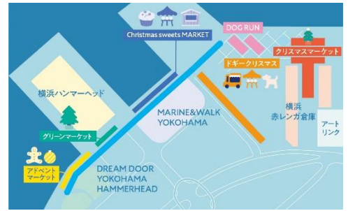
<会場マップイメージ>

※お客様に安心してイベントをお楽しみいただけるよう、新型コロナウイルス感染症予防と感染拡大防止のための取り組みを実施しています。