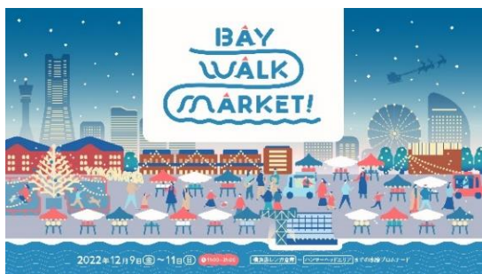
<イベントキービジュアル>