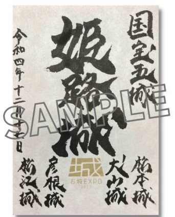
「国宝五城オリジナル御城印」