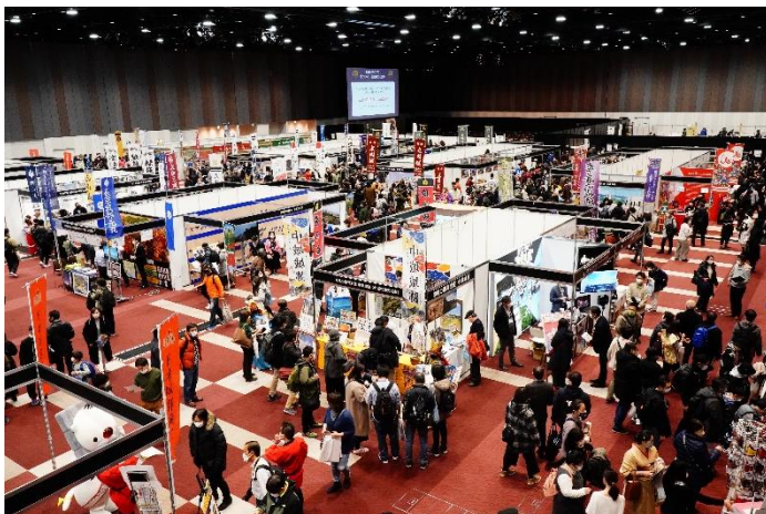
▲「城めぐり観光情報ゾーン」の様子（2021年）

さらに今回からお城 EXPO をより楽しんでいただけるよう会場内にフォトスポットを設置。甲冑姿の武将や忍者、姫や侍、町娘等に扮してのコスプレも歓迎いたします。会場内には着替えスペースもございますので戦国時代の武将やお忍びで城下を訪れた姫、他国の情報を探る忍びのものとなって『お城 EXPO 2022』をぜひお楽しみください。