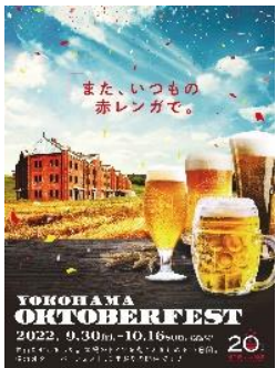
< イベントキービジュアル >

オクトーバーフェストは、ドイツ・ミュンヘンで1810年から開催されている、世界最大のビール祭りです。本イベントは、開催地「横浜赤レンガ倉庫」がドイツの建築様式を一部に取り入れた歴史的建造物であることから、 本場ドイツに限りなく近い雰囲気を楽しめるオクトーバーフェスト として2003年から開催しており、 今回で19回目の開催 となります。