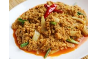
プーパッポンカレー ソフトシェルクラブの カレー炒め 1,200円