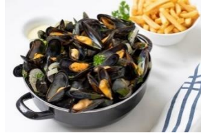
フライドポテト付き メガ盛りムール貝 1,400円