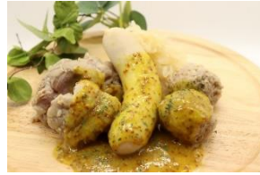
ジャーマンプレート 1,800円