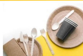
<脱プラスチックイメージ>

横浜みなとみらい 21 地区の「脱炭素先行地域」の取り組みに参画する施設として、「GTL 燃料」での発電によるイベントでの CO2 排出対策のほか、「グラスデポジット制」や「容器・コトラリ類の非プラスチック製品化」による脱プラスチックの取り組みと、環境先進国・ドイツに倣い、サステナビリティ活動を推進します。