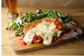
SCHMATZ 特製シュニッツェル ～ポークカツレツ～ 1,600円