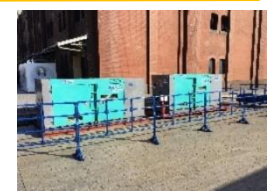
<GTL 燃料発電機イメージ>