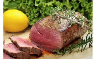
厚切りローストビーフ 1,600円