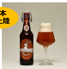
NEW GLANZ with DER HIRSCHBRAU