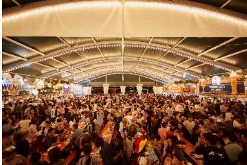
< 過去開催の様子 >