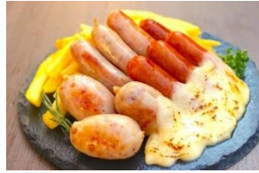
炙りチーズソーセージ 10本盛り 1,500円