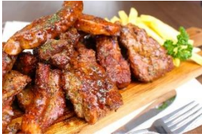
スペアリブステーキ フライドポテト付き 250g 1,400円～

※画像はイメージです。※価格は全て税込みです。 ※掲載内容は予告なく変更となる場合があります。