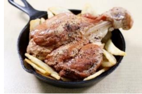
骨付きすね肉の スモークハム 2,100円 数量限定 20食/日