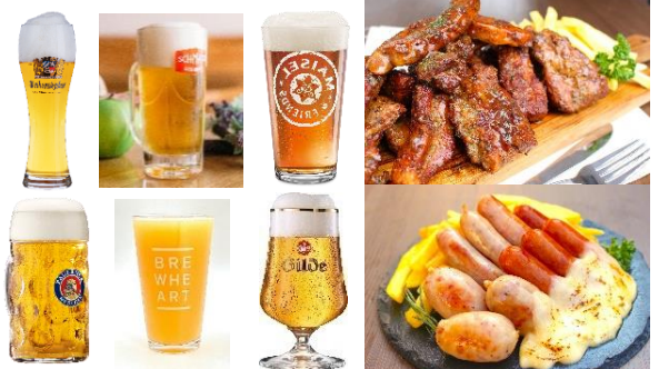
< 販売メニューイメージ >