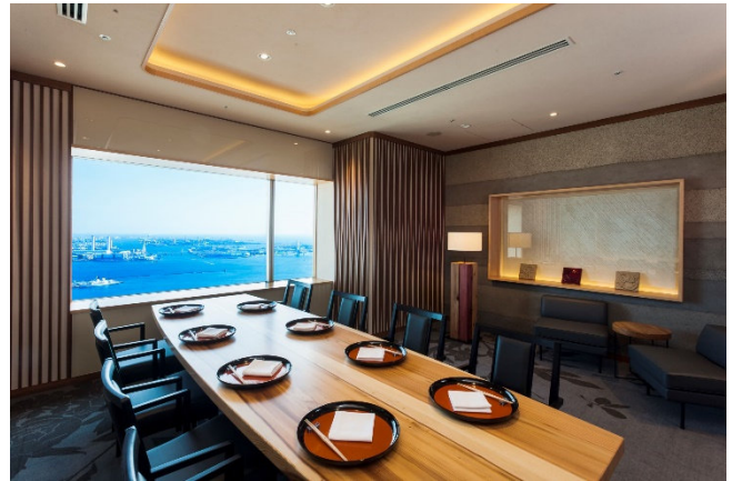
68階 日本料理「四季亭」 個室イメージ