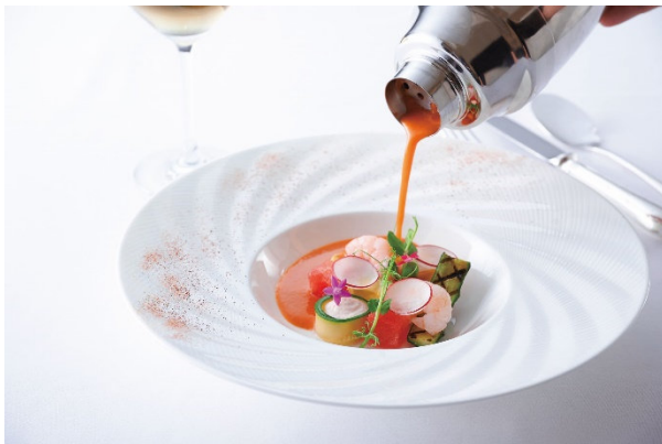
Menu Esprit(エスポワール) 料理イメージ