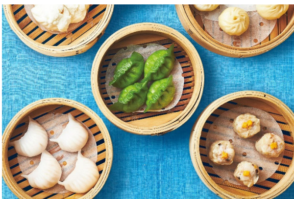
飲茶オーダーbuffet 料理イメージ