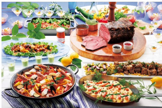
お盆スカイブッフェ 料理イメージ