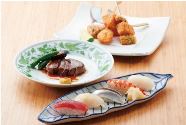
個室プラン 料理イメージ