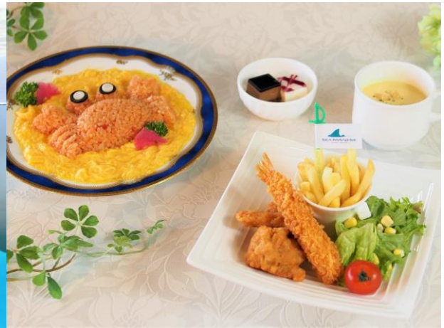
シーパラコラボ お子様ランチ