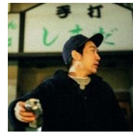
原島“ど真ん中”宙芳