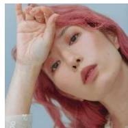
Lil'Leise But Gold