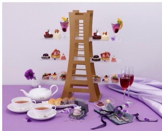
ランドマークアフタヌーンティーセット“STAR JEWELRY”