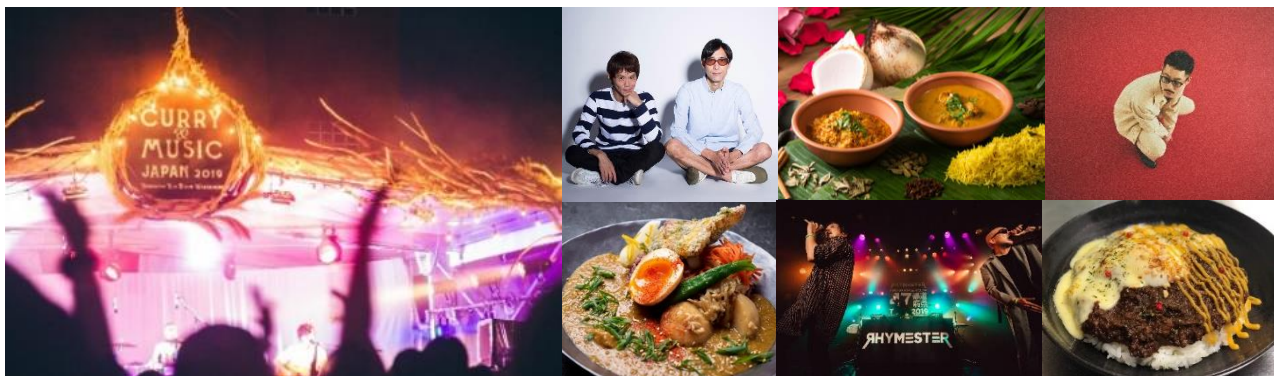
<イベント会場イメージ・出演アーティスト・出店カレーイメージ>

< 2022年7月16日(土)・17日(日)・18日(月・祝) 15日(金)プレオープン >