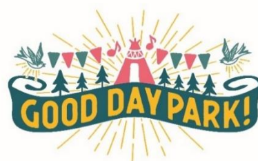
『GOOD DAY PARK! 2022』ロゴ

※天候や、新型コロナウイルス感染症の影響により、内容は変更・中止となる可能性がございます。 ※最新情報は施設公式HP ( https://www.mec-markis.jp/mm/ ) にてご確認ください。