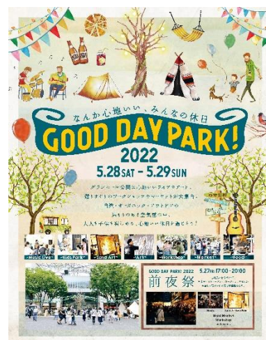
GOOD DAY PARK! 2022 5.28(土)・5.29(日) WEB: 特設サイトはこちら QRコード: