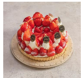
横須賀市「嘉山農園」完熟とちおとめいちごのタルト / 1ピース 908 円 (税込 980 円)