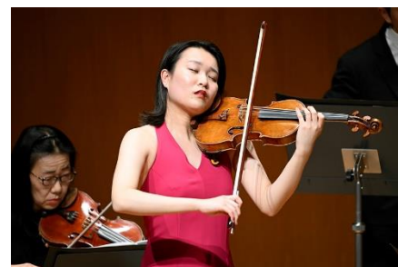
第I期の公演より