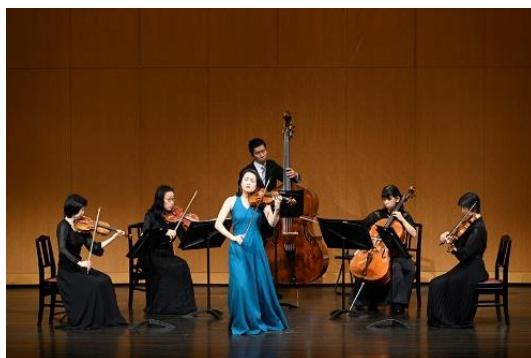
第 I 期の公演より