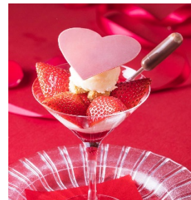
「赤いフルーツとルビーチョコレートのパフェ」

※カッコ内の表示料金にはサービス料13%・消費税10%が含まれております ※食材の入荷状況により、メニューが変更になる場合がございます ※写真はイメージです