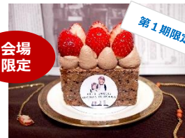
<湘南スイーツアキズ> あまおういちごとチョコの ナポレオンパイ／850円

snow-berry-ドーム／1,000円 イチゴをかまくらに見立てて ドーム状にしました。