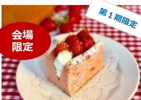
<馬車道十番館> いちごミルクシフォン／750円

〜いちごゼリーの装身具〜 ネットレス：各1,100円 リング：各990円 可愛くて美味しい小さないちごゼリーを 装身具にできたらうれしい！ そんなイメージでデザインしました。