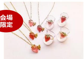
<秘密の苺 MICO E> gelée de fraise Bijoux

キャトルロール／864円 苺のダイスやクリーム、ジャムを使用した 異なる4種のプチロールを重ね、 華やかなデザートに。