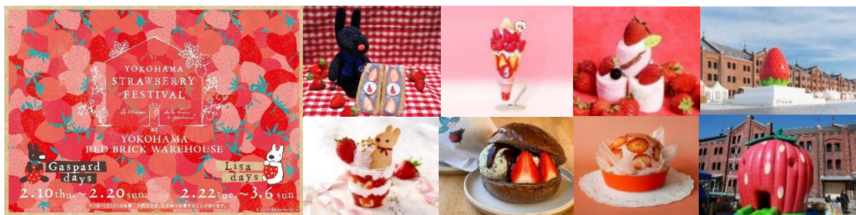
<イベントキービジュアル>

今年で9回目となる今回は、日本でも人気の高いフランス絵本のキャラクター“リサとガスパール”とのコラボレーションが実現し、ふたりと一緒に楽しめるいちごスイーツが登場。例年以上に多彩な“いちご”の魅力を堪能できる全期間計約30店舗のお店が、イベントを盛大に盛り上げます。