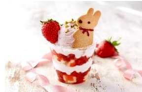
<YOKOHAMA BASHAMICHI ICE>

リサのストロベリーロイヤルミルクティー／660円 ガスパールのストロベリーラテ／660円