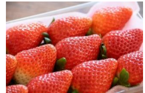
<銚田市 いばらきつす>