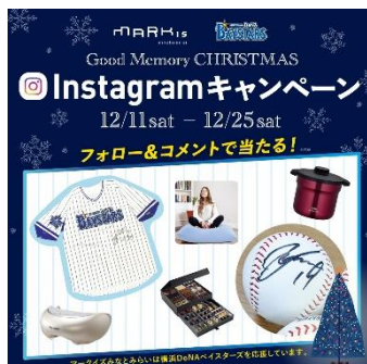
『Good Memory CHRISTMAS Instagram キャンペーン』 パナー