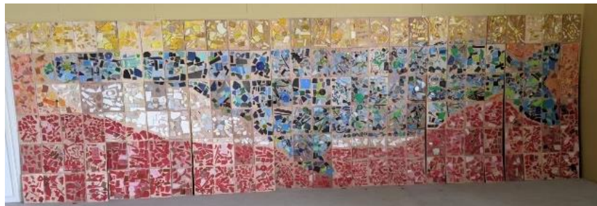
『SDGs アートウォール・プロジェクト』アートウォール イメージ

「横浜美術館」の仮囲いを活用し、未来への希望を込めたアートウォール作品を作る『SDGs アートウォール・プロジェクト』。アーティストと地域の方々やご来館の皆様と一緒に、SDGs をテーマとしたモザイクアートを制作するワークショップを開催いたします。