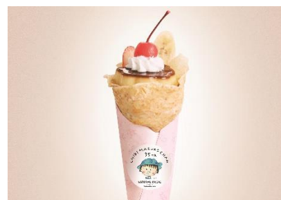
ナチュラルクレープ (B1F) まるちゃんのプリンアラモードクレープ 990円

しっとり艶やかなつづあんは、北海道産小豆を使用。皮には三重県産小麦「伊勢の響」、三重県産「地養卵」を使用。素材にこだわり、キメ細かくしっとりとした食感に仕上げました。