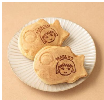
ちびまる子ちゃん コラボメニュー・コラボ商品（一例）