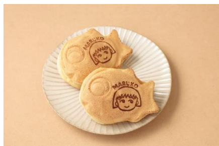
横浜くりこ庵 (B1F) ちびまる子ちゃん焼印たい焼き 200円

ちびまる子ちゃん35周年限定焼印入りたい焼きが登場！くりこ庵オリジナルの型を使ったたい焼きに、まるちゃんの好物のプリン味のクリームを入れた横浜くりこ庵マークイズみなとみらい店限定商品です。