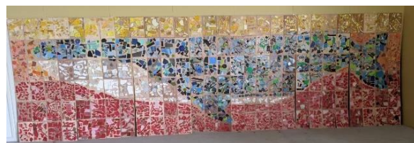
『SDGsアートウォール・プロジェクト』 アートウォール イメージ