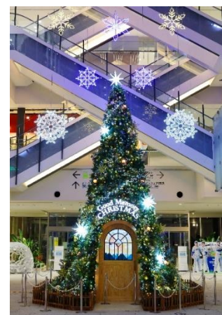
『Good Memory Crystal TREE』