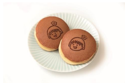
口福堂 (B1F) ちびまる子ちゃんどら焼 194円

※商品は仕入状況や、在庫状況により、ご提供できない場合や、内容や量が変わる場合がございます。