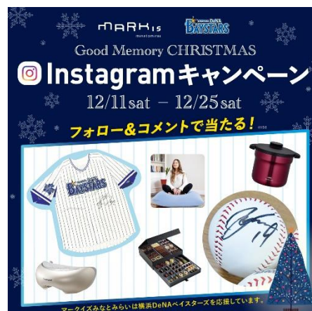
『Good Memory CHRISTMAS Instagram キャンペーン』バナー

施設公式 Instagram : https://www.instagram.com/markisminatomirai/