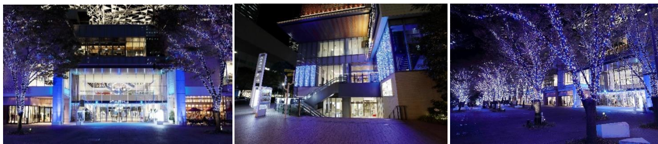
『Good Memory イルミネーション』

「Good Memory」をテーマに、ブルーを基調としたイルミネーションがMARK IS みなとみらいを彩ります。