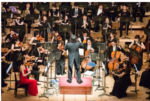
2015年2月開催フルオーケストラ演奏時

1987年兵庫県生まれ。5歳よりピアノを、15歳からクラリネットを、22歳から指揮を始める。2006年東京藝術大学入学後、渡仏。2008年フランス地方国立リュエル・マルメゾン音楽院を審査員満場一致の最優秀賞ならびにヴィルトオーゾ賞を得て高等課程を最短二年で卒業。2009年パリ国立高等音楽院に首席入学。2012年ジュネーブ国立高等音楽院首席入学。平成20年度文化庁新進芸術家海外派遣研修員平成21,22,24年度財団法人ロームミュージックファンデーション奨学生第9回KOBE国際学生音楽コンクール最優秀賞。第19回欧日音楽講座に於いて、ミシェル・アリニョン特別賞を特設され授与。大阪フィルハーモニー交響楽団(大植英次氏指揮)と共演。NHK-TVにて放映、NHK-FMに放送される。第5回東京音楽コンクール木管部門第1位及び聴衆賞。小澤征爾監督ロームミュージックファンデーション指揮クラスのアオーディションに合格、以後指揮セミナーを継続して受講。サイトウ・キネン・フィスティバル松本+松本市民芸術館共同企画「兵士の物語」に毎年出演。文化庁京都国民文化祭「オーケストラの祭典 in 長岡京」にて指揮。2014年トヨタ・マスター・プレイヤーズ、ウィーンソリストに抜擢され全国ツアーに参加。巨匠ベーター・シュミードル氏と「クロンマー:2つのクラリネットのための協奏曲」を演奏。アルバム「くらりずむ」をリリース。これまで、サントリーホール、東京文化会館、紀尾井ホール、松方ホールをはじめ、国内各地の主要ホールでリサイタル、コンチェルトを行う。くらしき作陽大学指揮科非常勤講師。京都おもてなし音絵巻プロデューサー。