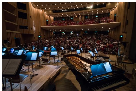
伝説の戦闘組曲イメージ