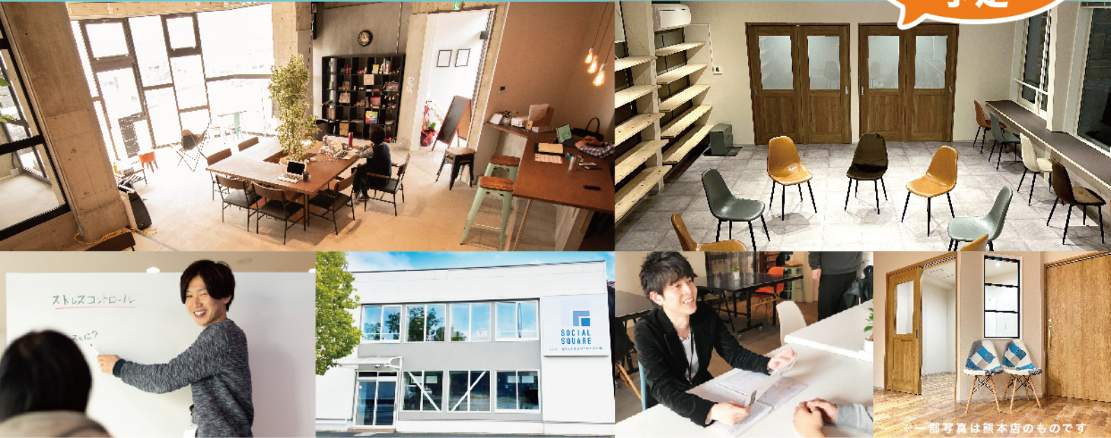
*一部写真は熊本店のものです