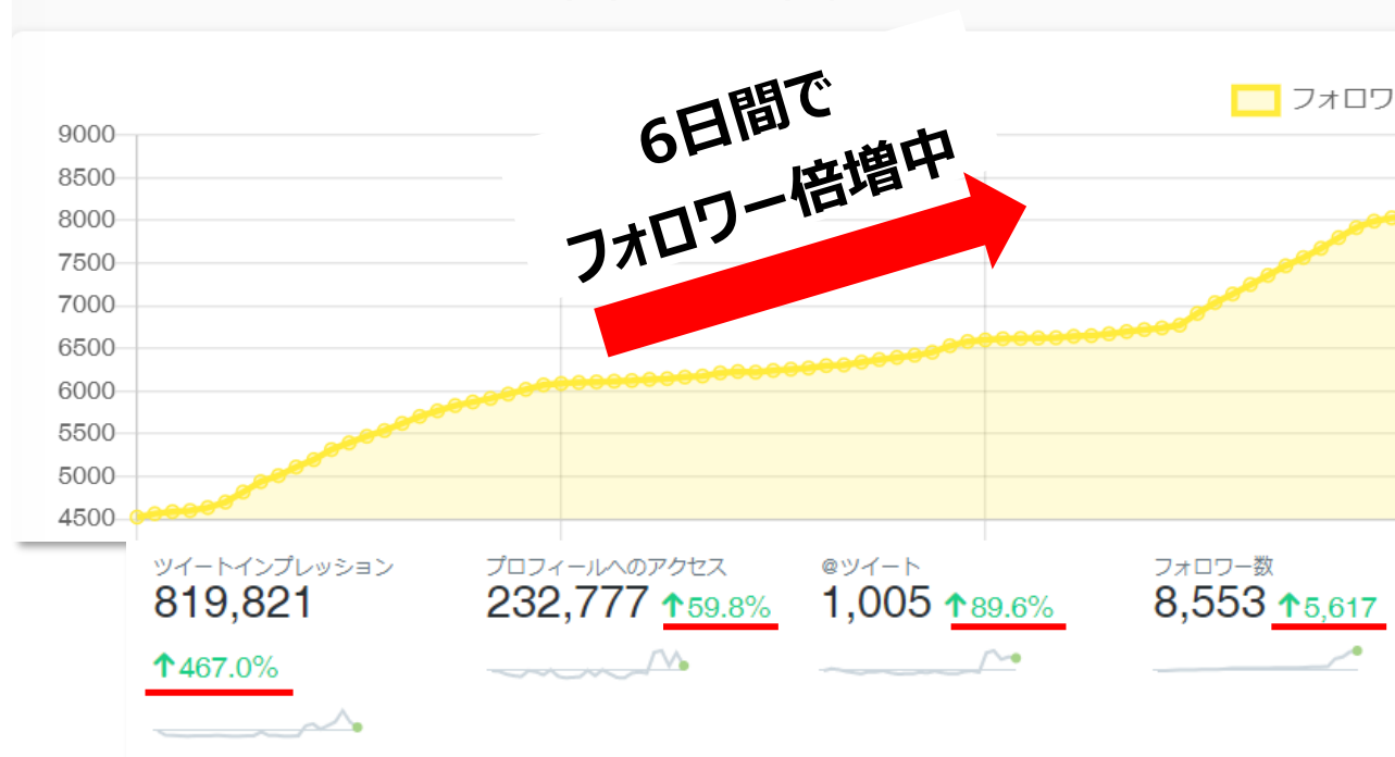
フォロワー数 【計測期間】2022/3/3~2022/3/9