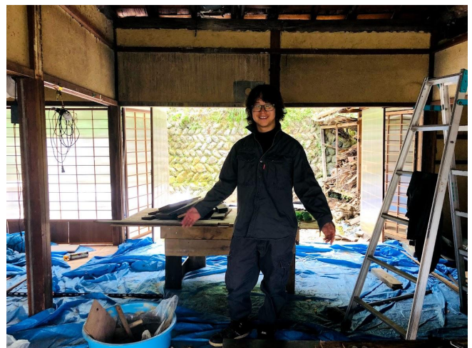
▲ 成約4軒目のコンセプトデザイナー(借り手)