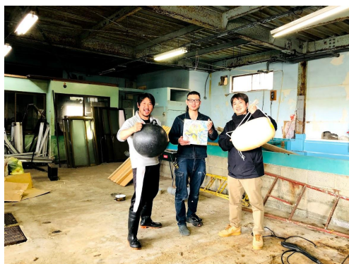
▲成約3軒目の海洋プラアーティスト(借り手)と漁師(家主)