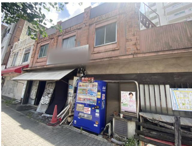
▲ 成約7軒目のシーシャ屋(改装中)