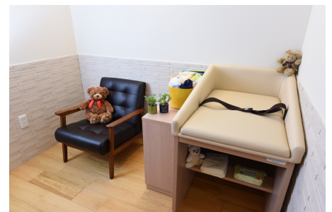
★小さなお子様づれでも安心「授乳室」完備