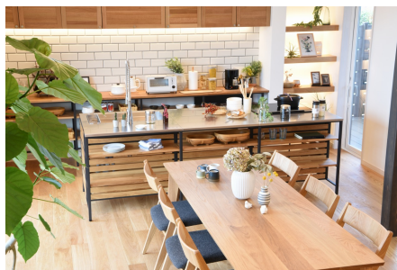
★利便性とデザイン性のあるダイニングキッチン