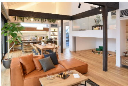
★勾配天井を利用した開放感ある LDK

手作業で一つ一つ心を込めて作られる“天使のらすく”は地元産の蜂蜜を使い、グラノーラをのせたラスクなど、優しい風味とさくさく、パリパリな食感で人気のある「らすく工房 美・Sekiyama」様とコラボレーションしたオリジナルギフトをご来場されたお客様にプレゼントいたします。