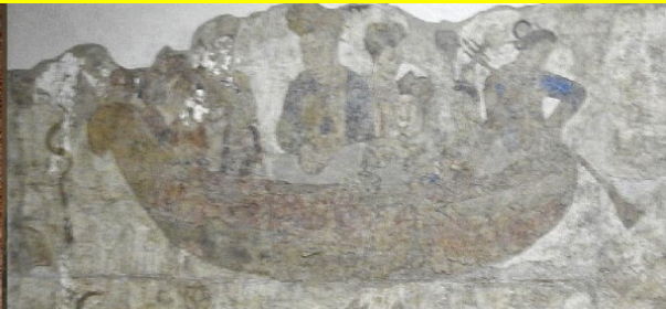
サマルカンドのアフラシャブ壁画 舟に乗るソグドの女性