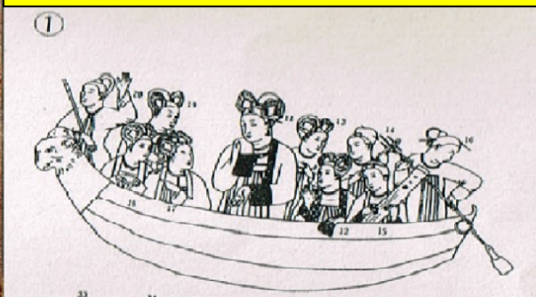
シルクロード学叢書7「古代奈良にみる装い文化とシルクロード」より アフラシャブ壁画復元図/菅谷文則