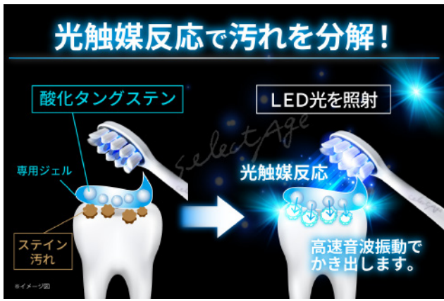
▼ 光触媒によるホワイトニングの実験