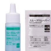
滴下ボトル(左)、 ワイプシート(右)

医療機関では医療機器取扱商社から、オストメイトの方は病院の売店や医療器械店などで購入できます。