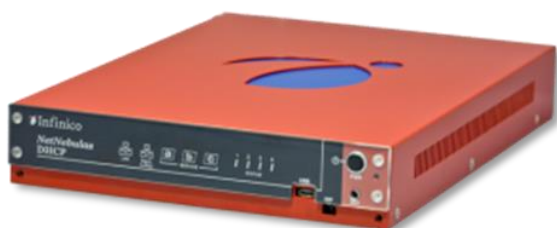
図2) FIDO2 認証アプライアンスサーバー (中～大規模) FIDO2® Server