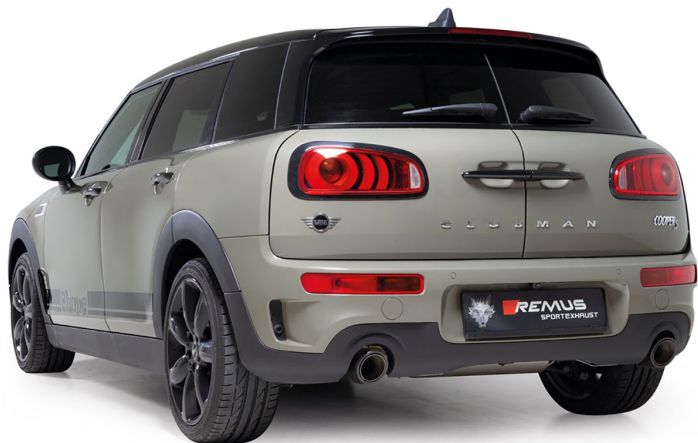
Mini Clubman Cooper S F54 2.0l