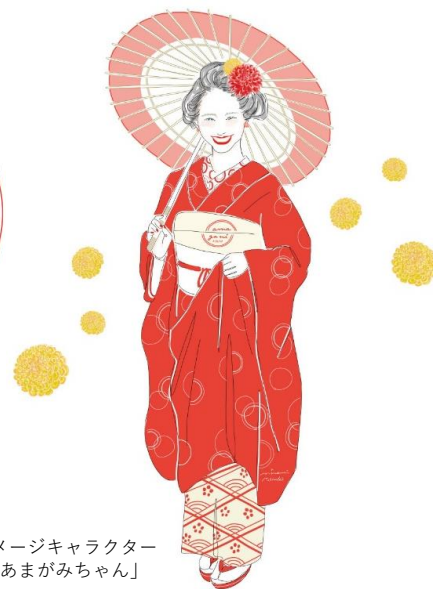
イメージキャラクター 「あまがみちゃん」