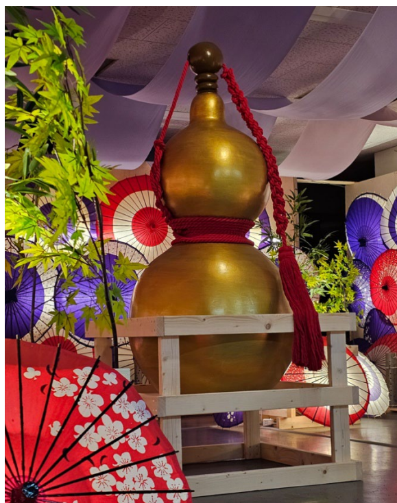
シンボルの 1.8m の巨大瓢箪 （天然ではありません）

株式会社レスト関ヶ原が運営する観光テーマパーク「関ヶ原グルメガーデン」内の関ヶ原合戦を再現したテーマパーク型資料館「関ヶ原ウォーランド」では、2024 年 12 月 20 日（土）から約 1,000 個の瓢箪（ひょうたん）を展示する季節企画「ひょうたん祭」を初開催します。瓢箪は古来より「子孫繁栄」「魔除け・開運招福」「無病息災（六瓢息災）」「三拍子揃う」などの象徴であり、縁起物とされています。来年の NHK の大河ドラマは「豊臣兄弟」ですが、豊臣秀吉は馬印に瓢箪を用いており、戦勝のたびに瓢箪を 1 つずつ増やして千にすると誓った「千成瓢箪」の故事が有名です。本イベントでは瓢箪を約 1,000 個展示し、これまで展示してきた和傘や竹ランタンとともに、和の風景を楽しんでいただけます。瓢箪の豆知識や、豊臣秀吉の千成瓢箪物語について学べるコーナーも用意しています。また、金運アップを祈願する金色の 1.8m の巨大瓢箪や、6 色に色分けした“6 つの瓢箪祈願所”で、新年の開運を祈願していただけます。