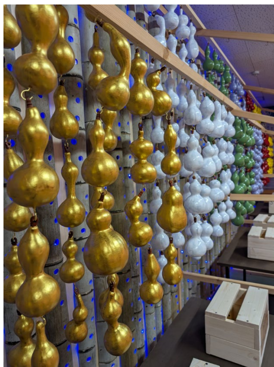
6 色に色分けした 6 つの瓢箪祈願所