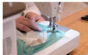
お直し・リペア体験