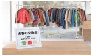
古着の回収 & 交換会