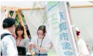
京都市 脱炭素ブース