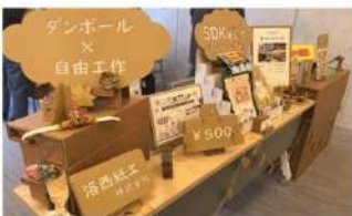
ダンボールアップサイクル