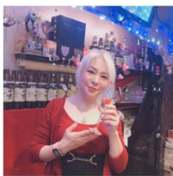
浅草口ゼ (東京 浅草) ニューハーフママの店「浅草口ゼ」

「オンラインスナック横丁」は、全国に実店舗を持つスナックのママと利用者をオンラインでつなぐサービスです。利用者は、WEB上に掲載されている様々なスナックから好みの店舗を選び、入場チケットを購入するだけ。普段スナックの重い扉を開くことが出来なかった人でも気軽に参加でき、自宅にいながら様々な人柄やホスピタリティにあふれるスナックママとの会話を楽しむことができます。様々な地域のスナックが軒を連ねているので、2軒、3軒とはしご酒してみたり、ママの方言や地域ならではの地元話が楽しめるなど、全国を旅するような気分を味わえるのも特徴です。