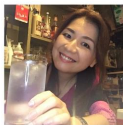
スナック AERU (東京 新橋) 婚活スナックで話題「スナック AERU」