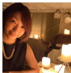
スナック みづほ (東京 五反田) 癒しの小部屋「スナック みづほ」