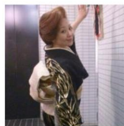
スナック 松 (神奈川県 逗子) 飲んで歌って皆を元気に！「スナック 松」