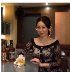
アデージョ (東京 渋谷) 渋谷の隠れ家スナック「艶女～アデージョ～」