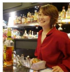
スナック 杉の子 (東京 渋谷) ママと話せば元気になれる！「スナック 杉の子」