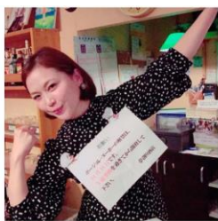
スナック SUN (宮崎 西橋通) 宮崎ニシタチの人気店「スナック SUN」