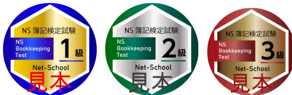
図2 合格者に付与したバッジの画像(見本)