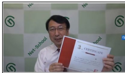
3級試験の説明中(弊社代表)