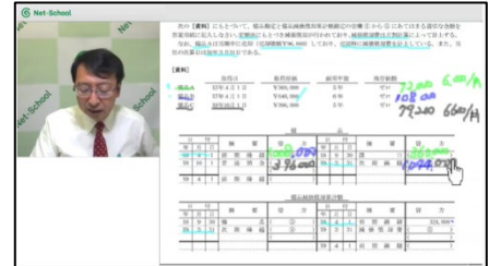
試験後に配信した解説動画