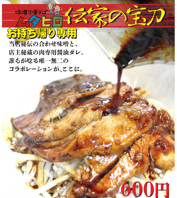
2号店 鶏そばムタヒロ

味噌中華そば ムタヒロ 伝家の宝刀 お持ち帰り専用 当唐秘伝の合わせ味噌と、 店主秘蔵の肉専用醬油ダレ。 誰もが喰る唯一無二の コラボレーションが、ここに。 600円