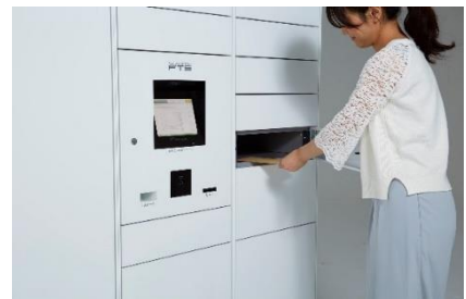
フルタイムロッカー

世界に先駆け宅配ボックス・宅配ロッカーを開発し、「最も長期に亘って営業している電気式宅配ロッカーサービスプロバイダー*2」として、ギネス世界記録™に認定されています。また国連の定める SDGs（持続可能な開発目標）実現のための活動に取り組んでおり、宅配ボックスの整備により荷物の再配達を減らし CO2削減による地球温暖化防止への功績が認められ環境大臣賞「環境保全功労者表彰」を受賞しております。創業時から38年以上にわたりお客様の声に耳を傾け、宅配ボックス・宅配ロッカーと24時間有人対応のコントロールセンターを核とし、レンタサイクル、カーシェアリング、EV充電など、住生活を豊かにする設備やサービスを提供し、現在では集合住宅を中心に戸建て、オフィス、店舗、公共施設などへのフルタイムロッカー設置件数50,000カ所を超え、年間で555万人以上を超える方々にご利用いただいています。（2023年12月時点）