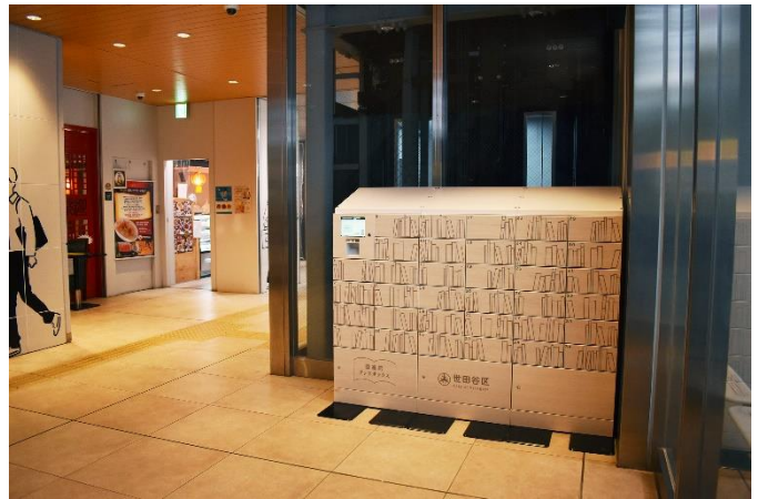
小田急線下北沢駅構内「ブックボックス下北沢」