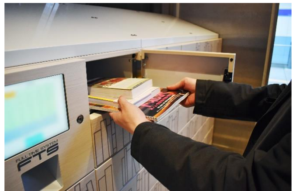
予約した本の非対面受け取り

フルタイムボックス ■機器ユニット名称:「Fulltime box」 https://www.fts.co.jp/start/public/