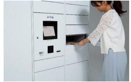
フルタイムロッカー

世界に先駆け宅配ボックス・宅配ロッカーを開発し、「最も長期に亘って営業している電気式宅配ロッカーサービスプロバイダー*2」として、ギネス世界記録™に認定されています。また国連の定める SDGs（持続可能な開発目標）実現のための活動に取り組んでおり、宅配ボックスの整備により荷物の再配達を減らし CO2削減による地球温暖化防止への功績が認められ環境大臣賞「環境保全功労者表彰」を受賞しております。創業時から38年以上にわたりお客様の声に耳を傾け、宅配ボックス・宅配ロッカーと24時間有人対応のコントロールセンターを核とし、レンタサイクル、カーシェアリング、EV充電など、住生活を豊かにする設備やサービスを提供し、現在では集合住宅を中心に戸建て、オフィス、店舗、公共施設などへのフルタイムロッカー設置件数50,000カ所を超え、年間で555万人以上を超える方々にご利用いただいています。（2023年12月時点）