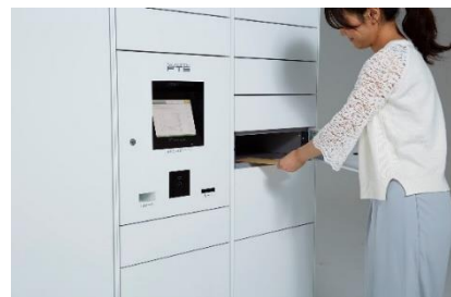
フルタイムロッカー

フルタイムシステムは、世界に先駆け宅配ボックス・宅配ロッカーを開発し、「最も長期に亘って営業している電気式宅配ロッカーサービスプロバイダー*3」として、ギネス記録を樹立した企業です。また国連の定める SDGs（持続可能な開発目標）実現のための活動に取り組んでおり、宅配ボックスの整備により荷物の再配達を減らし CO 2 削減による地球温暖化防止への功績が認められ環境大臣賞「環境保全功労者表彰」を受賞しております。創業時から 35 年以上にわたりお客様の声に耳を傾け、宅配ボックス・宅配ロッカーと 24 時間有人対応のコントロールセンターを核とし、レンタサイクル、カーシェアリング、EV 充電など、住生活を豊かにする設備やサービスを提供し、現在では集合住宅を中心に戸建て、オフィス、店舗、公共施設などへのフルタイムロッカー設置件数 47,000 カ所を超え、年間で 519 万人を超える方々にご利用いただいています。（2022 年 12 月時点）