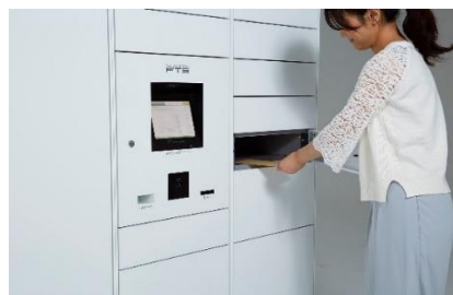
フルタイムロッカー

当社は、世界に先駆け宅配ボックス・宅配ロッカーを開発し、「最も長期に亘って営業している電気式宅配ロッカーサービスプロバイダー*2」として、ギネス記録を樹立した企業です。また国連の定める SDGs（持続可能な開発目標）実現のための活動に取り組んでおり、宅配ボックスの整備により荷物の再配達を減らし CO2 削減による地球温暖化防止への功績が認められ環境大臣賞「環境保全功労者表彰」を受賞しております。また創業時から 35 年以上にわたりお客様の声に耳を傾け、宅配ボックス・宅配ロッカーと 24 時間有人対応の