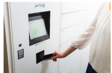
とよかんカードのバーコードをかざして受取り