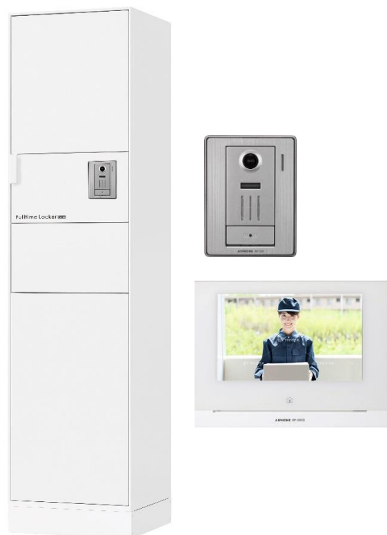
【宅配ボックスの扉が開かれると自動録画】

アイホンのテレビドアホンと連動する「フルタイムロッカーホーム」で、いたずらや盗難を未然に防止でき、安心安全で確実に大切な荷物の受け取りと届けられる環境が実現できます。