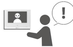
【自宅のモニターで録画を確認】