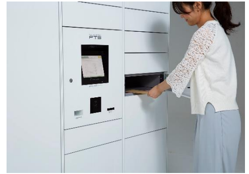
フルタイムロッカー

フルタイムシステムは、世界に先駆け「宅配ボックス」「宅配ロッカー」（フルタイムロッカー）を発明し、集合住宅を中心に戸建て、オフィス、駅などへの設置件数36,000棟を超える宅配ボックス・宅配ロッカーのリーディングカンパニーです。30年以上にわたりお客様の声に耳を傾け、宅配ボックス・宅配ロッカーと24時間有人対応のコントロールセンターを核とし、レンタサイクル、カーシェアリング、EV充電など、住生活を豊かにする設備やサービスを提供しています。今後も集合住宅のみならず、オフィス、店舗、学校、公共施設など、あらゆるシーンでより快適な生活環境の創出と利便性の向上を目指します。