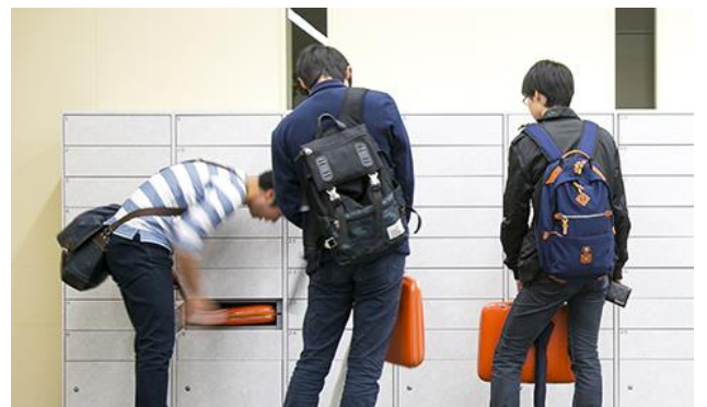
【24 時間無人で運用が可能】