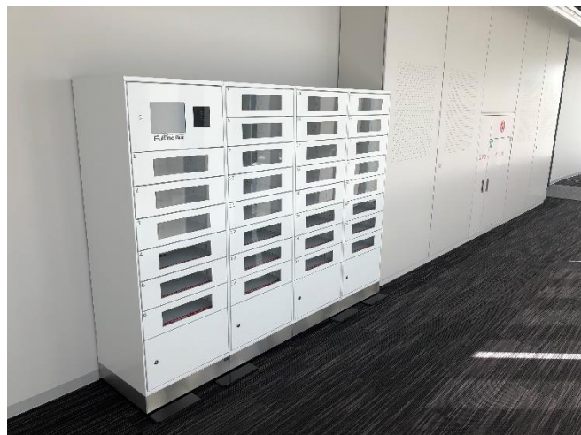
【宅配ロッカーがPC貸出を無人代行】

今後、対面型とオンラインでの講義の両方が実施されることにより、学生は受講する環境を早急に整備する必要に迫られます。そのため名城大学では、学習環境を整え、安心して授業を受けられるための措置として、当社の「フルタイムボックス」を設置する運びとなりました。