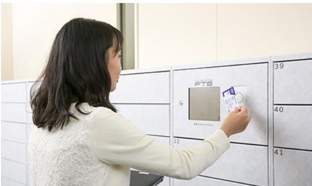
【学生証をロッカーの操作カードとして使用】