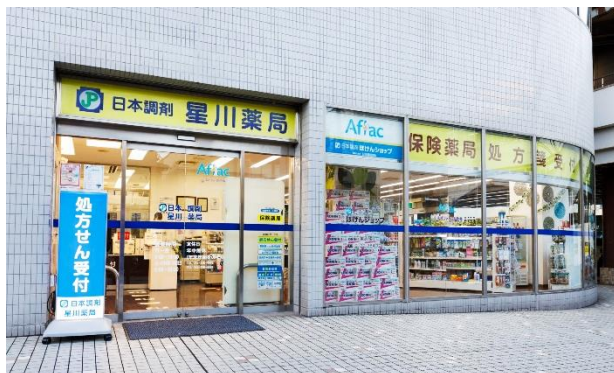
【日本調剤 星川薬局】

世界に先駆け宅配ロッカー・スマートピックアップロッカーを開発、展開する株式会社フルタイムシステム(本社：東京都千代田区 代表：原 幸一郎 以下 フルタイムシステム)は、全国47都道府県で調剤薬局を展開する日本調剤株式会社(本社：東京都千代田区、代表取締役社長：三津原 庸介、以下 日本調剤)とスマートピックアップロッカー「フルタイムロッカー」を使った、非接触での処方薬の受け渡しを開始します。今後、新しい生活様式に適した安心安全な処方薬の受け取り方をご提案してまいります。