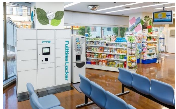
【非接触での処方薬の受け渡しを実現】