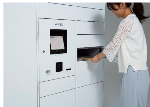
フルタイムロッカー

フルタイムシステムは、世界に先駆け「宅配ボックス」「宅配ロッカー」（フルタイムロッカー）を発明し、集合住宅を中心に戸建て、オフィス、駅などへの設置件数34,000棟を超える宅配ボックス・宅配ロッカーのリーディングカンパニーです。30年以上にわたりお客様の声に耳を傾け、宅配ボックス・宅配ロッカーと24時間有人対応のコントロールセンターを核とし、レンタサイクル、カーシェアリング、EV充電など、生活を豊かにする設備やサービスを提供しています。今後も集合住宅のみならず、オフィス、店舗、学校、公共施設など、あらゆるシーンでより快適な生活環境の創出と利便性の向上を目指します。