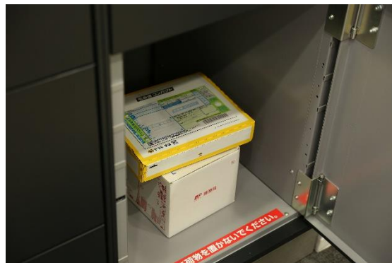
追加の配達物もまとめて一つのボックスに入庫が可能

幹事宅配事業者がフルタイムロッカー（宅配ロッカー、宅配ボックス）のボックス内に荷物を収納し、追加の配達物もボックスにまとめて入庫。一旦入庫した配達物を取り出してまとめて配達することもできるマルチ操作タイプの宅配ロッカー、宅配ボックスです。