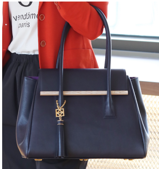
（「ARIANNA」の新色「ロイヤルネイビー」）

日本製とエシカルにこだわったバッグブランド「FUMIKODA」を企画・販売する株式会社 FUMIKODA（以下「当社」）は、当社のバッグを持ち始めてから昇進されたお客様から「出世バッグ」と呼ばれている「ARIANNA（アリアナ）」に新色「ロイヤルネイビー」が登場したことをお知らせいたします。