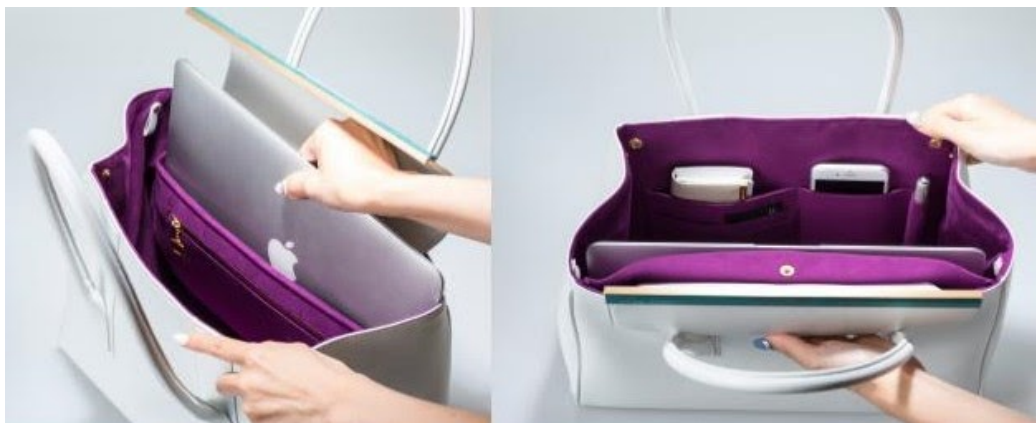
(PC、スマホ、カードケース&ペンもこんなにスマートに収納可)

機能、デザイン、品質の全てにこだわりました。トレンドに左右されず、洗練された見た目でおしゃれで、クラス感があり、何よりも軽いです。大容量でA4の書類やPCが収納でき、また出し入れもスムーズなレディース用お仕事バッグです。通勤時、営業等の外出時、会食時、出張時など、いかなるシーンでも働く大人の女性の最高のパートナーになります。