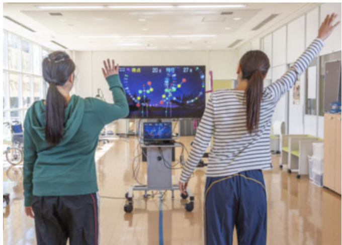
TANOを使ったゲーム体験