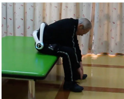
体幹・股関節屈曲による前屈