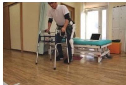
立ち座りやバランス練習