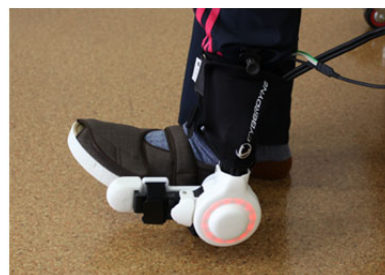
足関節の曲げ伸ばし練習