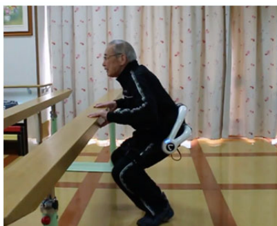
手すり把持スクワット