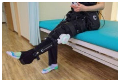
膝の曲げ伸ばし練習