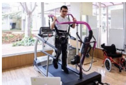
免荷装置等での歩行練習