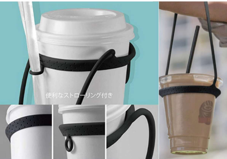
便利なストローリング付き

スタバやタリーズ、コンビニコーヒーのカップに取付できます。 タンブラーにも対応 (タンブラーエッジがあるものに限り)