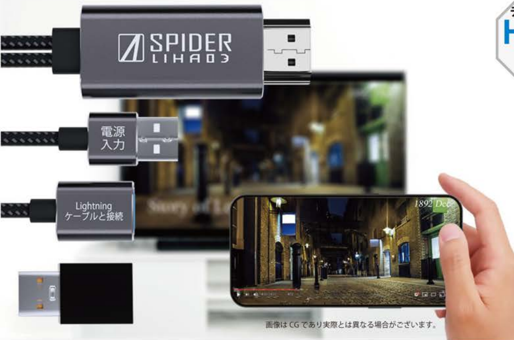
画像はCGであり実際とは異なる場合がございます。